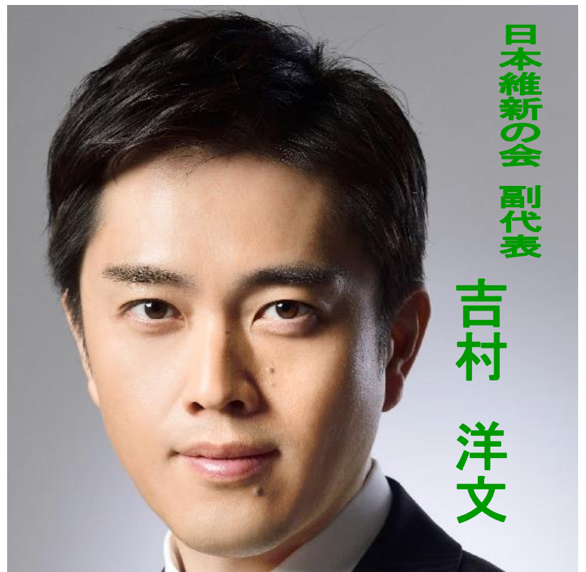
日本維新の会 副代表